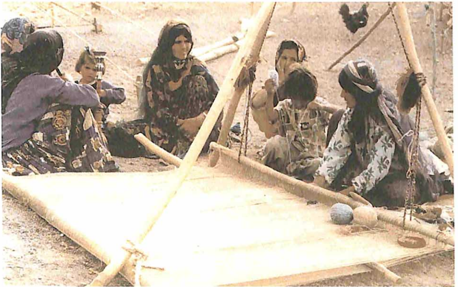
. Merfeç dokuyan bunkenin hanımları